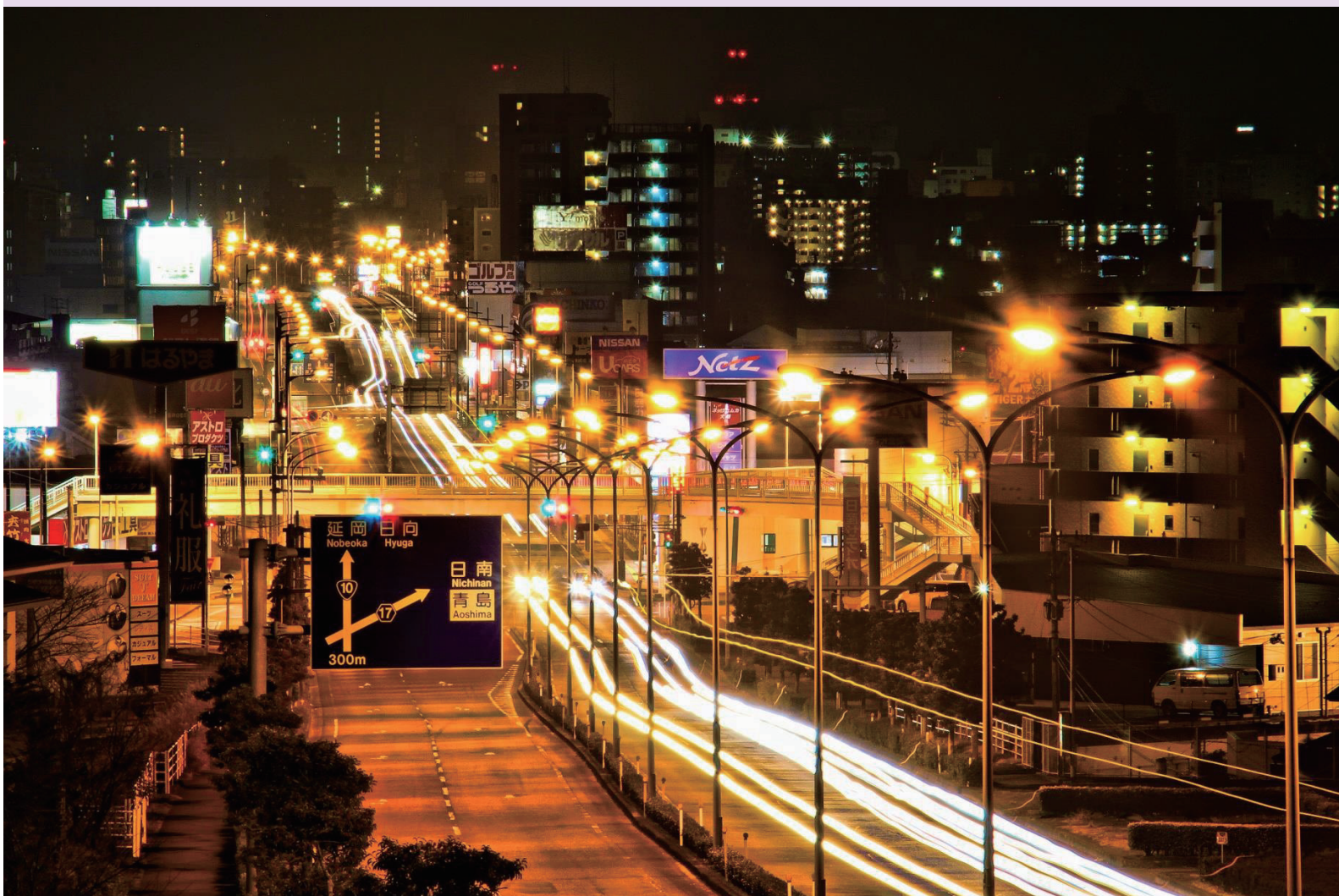
宮崎市大塚台から眺めた国道10号線と中心市街地