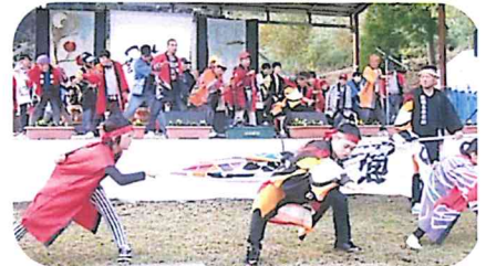
つよし寮 「ソーラン節」

しゃかいふくしほうじん つよし会 しょうがいしゃしえんしせつ つよし寮 「ソーラン節」